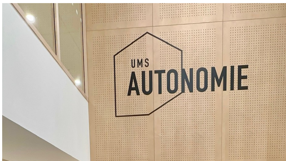
UMS Autonomie